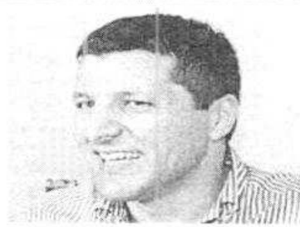
Il sindaco Federico Piccitto

●●● Sono in scadenza, nel mese di gennaio i termini, di presentazione delle offerte relative ad alcune procedure aperte bandite dal Comune di Ragusa. Scade il prossimo 13 gennaio, alle 12, il termine per presentare le offerte relative ai "lavori di rifacimento della rete acquedottistica nella via Sant'Anna e nelle vie limitrofe". L'importo complessivo dell'appalto ammonta a 1.162.087,18 euro. L'apertura delle buste avverrà il 15 gennaio, alle 12. Per i "lavori di rifacimento della rete acquedottistica di via Psaumida e vie limitrofe" le offerte dovranno essere presentate entro le ore 12 di giorno 19. La relativa gara sarà esperita il 21, alla stessa ora. Importo complessivo dell'appalto è di 1.188.152,61 euro. Entro le 12 del 21 gennaio dovranno pervenire le offerte per i "lavori di rifacimento della rete acquedottistica di Corso Mazzini e vie limitrofe". L'importo complessivo dell'appalto è di 693.658,23 euro. La gara sarà